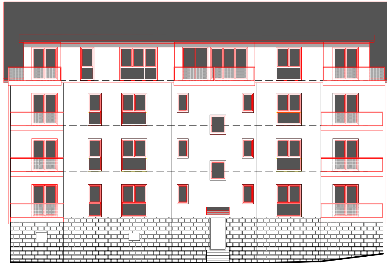
Ansicht von Südosten